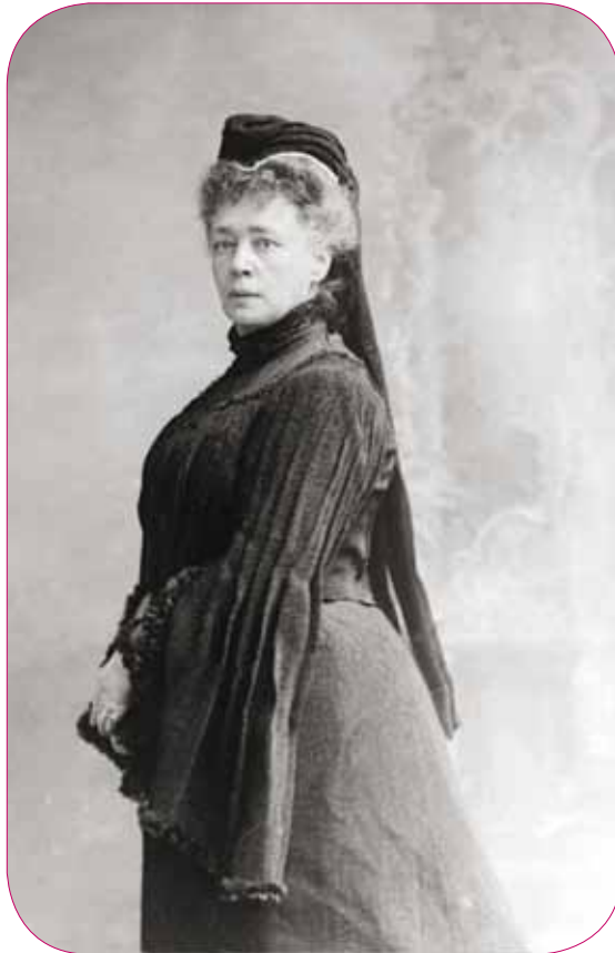
Bertha Von Suttner